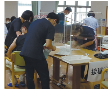
施設内で新型コロナウイルスワクチンを接種する職員ら

同施設は2022年度の「いわて健康経営認定事業所」に認定されました。毎月開催されている安全衛生委員会を中心に、職員の健診やワクチン接種の推進、ストレス軽減に取り組みんでいます。また、介護業務による心身への負担を減らすために、腰痛予防や健康管理について学ぶ機会を設けています。